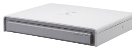
Flatbed Scanner Unit 201 para formato A3