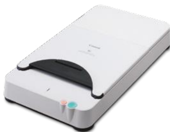
Flatbed Scanner Unit 101 para formato A4

Escanee libros encuadernados, diarios de contabilidad y documentos frágiles añadiendo el escáner Flatbed Scanner Unit 101 para documentos hasta formato A4 o el escáner Flatbed Scanner Unit 201 para documentos en formato A3. Estos escáneres planos se conectan mediante USB y ofrecen un escaneado doble armonizado con el DR-6030C que le permite aplicar las mismas funciones de mejora de imagen a cualquier documento escaneado.